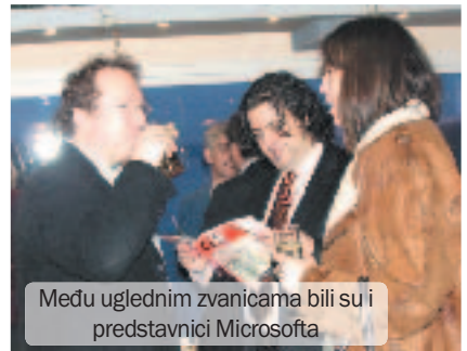
Među uglednim zvanicama bili su i predstavnici Microsofta