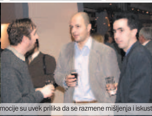
Promocije su uvek prilika da se razmene mišljenja i iskustva