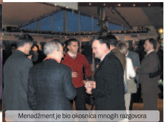
Menadžment je bio okosnica mnogih razgovora