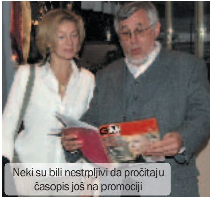
Neki su bili nestrpljivi da pročitaju časopis još na promociji