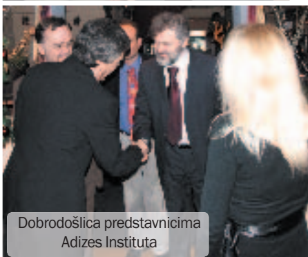
Dobrodošlica predstavnicima Adizes Instituta